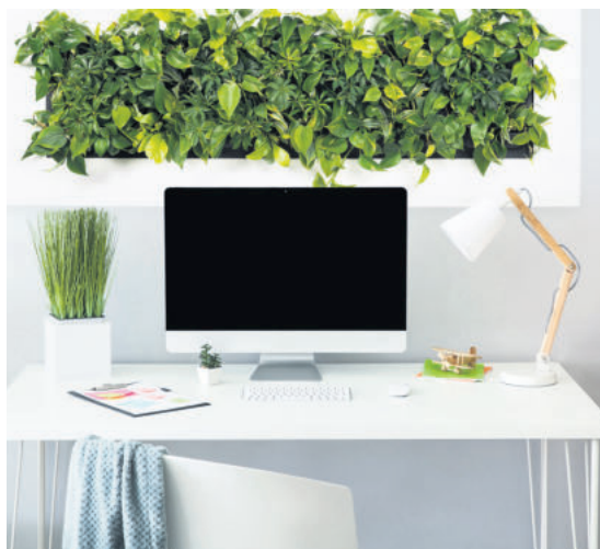
Bild links LivePicture GO. Bild rechts LivePicture 3.