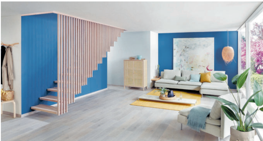
Treppe undercover: Seitliche Holzlamellen lassen Stufen und Geländer dezent in den Hintergrund treten. Im Raum selbst werden die Lamellen zum gestalterischen Element, sie bilden eine eigene Wand, die für klare Linien und Strukturen sorgt.

Gerade im Wohnbereich sind Treppen aus Holz der Klassiker überhaupt. Es gibt sieben gute Gründe, die für Holztreppen sprechen: